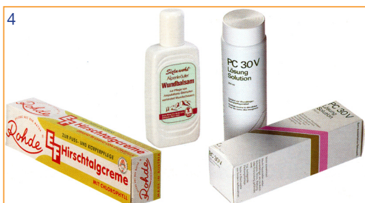
Produit de soin pour moignon Pc 30 V Sixtuwohl Crème Hirschtalg