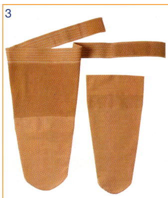
Bas de compression sur mesures